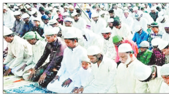
है। सभी धर्म में सप्ताह के किसी दिन को विशेष माना जाता है। बात करें इस्लाम धर्म की तो इस्लाम में अल्लाह की इबादत करने के लिए शुक्रवार यानी जुमा को बेहद खास माना गया है। इस दिन मुस्लिमबंधु नमाज अदा कर खुदा की इबादत के लिए मस्जिदों में पहुंचते हैं। खासकर रमजान के पाक महीने में पड़ने वाले जुमे की विशेष

माह-ए-रमजान चांद दिखने की तस्दीक के साथ 11 मार्च से शुरू हो चुका है। मुस्लिम बंधुओं ने 12 मार्च को पहला रोजा रखा। 15 मार्च को रमजान का पहला जुमा पड़ा। इसे लेकर मस्जिदों में बड़ी संख्या में मुस्लिम बंधुओं ने नमाज अदा की। इसी तरह दूसरे जुमा को शहर सहित उपनगरीय इलाके के इबादतगहों में मुस्लिमों की भीड़ रही इस बार रमजान में 4 जुमा पड़ रहे हैं। इस्लाम में जुमा की नमाज की खास अहमियत है। वहीं रमजान में पड़ने वाले जुमे को महत्व और बढ़ जाता