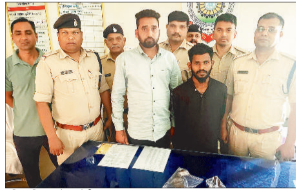
पुलिस गिरफ्त में आरोपी व जप्त कट्टा व कारतूस।

जिला पुलिस की टीम ने तीन अलग-अलग स्थानों में दबिश देकर रिवाल्वर और देशी कट्टा बचेने की फिराक में ग्राहक तलाश रहे तीन युवकों को पुलिस ने गिरफ्तार किया