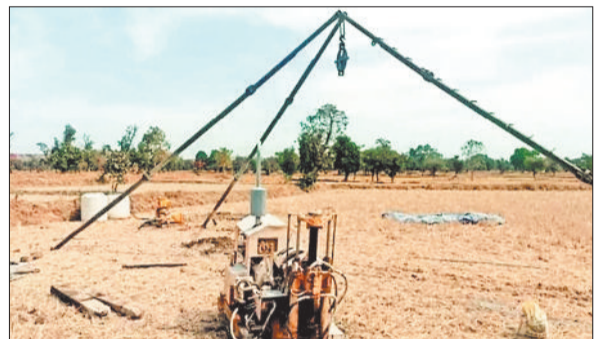
हरिभूमि न्यूज | कोरबा

घुचापुर कटघोरा के आसपास के 250 हेक्टेयर क्षेत्र में लिथियम पाए जाने की पुष्टि जियोलॉजिकल सर्वे ऑफ इंडिया ने की। जिसके लिए नीलामी की प्रक्रिया शुरू हो गई है। बोली में ओला, वेदांता, जिंदल, श्री सीमेंट, अडाणी समूह, अल्ट्राटेक सीमेंट सहित अनेक बड़ी कंपनियों शामिल थी। अर्जेंटीना की एक कंपनी की भी बोली में भाग लेने की जानकारी मिली है। लिथियम खदान के कटघोरा ब्लॉक में खुलेंगी। केन्द्रीय खान मंत्रालय द्वारा बुधवार को की गई नीलामी में कटघोरा लिथियम ब्लॉक के लिए रिजर्व प्राइज 2 प्रतिशत के विरुद्ध 76.05 प्रतिशत की बोली आई, जो रिजर्व प्राइज से 38 गुना अधिक है। हालांकि अभी सफल बोलीदाता का नाम सामने नहीं आया है। कटघोरा के लिथियम ब्लॉक के लिए कंपोजिट लाइसेंस दिया जा रहा है। इसमें परीक्षण व खनन दोनों का ही अधिकार शामिल है। कटघोरा के साथ ही कश्मीर के लिथियम ब्लॉक की भी नीलामी शुरू की गई। किंतु शुरुआती दौर में ही इसके लिए समुचित बोलीदार आगे नहीं आए, जिसके कारण एमएसटीसी पोर्टल पर चल रही इसकी ऑनलाइन नीलामी रोक दी गई। लिथियम की #खब पेज 3 पर