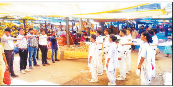
शाय लते छात्राएं।