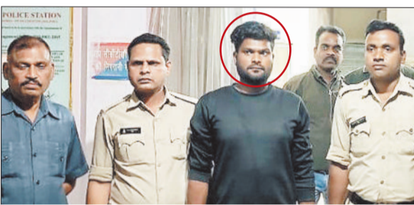
लाल घेरे में पुलिस गिरफ्त में नकली सीबीआई अधिकारी।