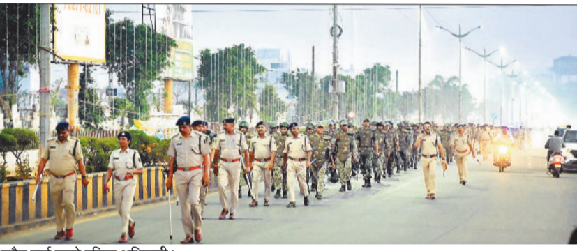
फ्लैग मार्च करते पुलिस अधिकारी।